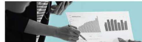
Fondos de Inversión