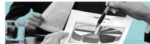
Proyectos de Inversión Específicos